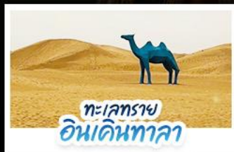
ทะเลทราย อินเคินทาลา