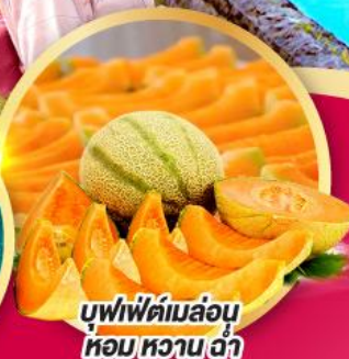
บุฟเฟ่ต์เมล่อน หอม หวาน ฉ่ำ