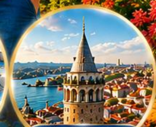
หอคอยกาลาตา Galata Tower