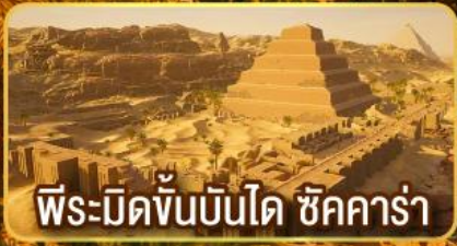
พีระมิดขั้นบันได ชิคคาร์่า