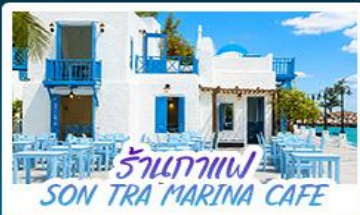
ร้านกาแฟ SON TRA MARINA CAFE