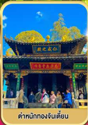
ตำหนักทองจีนเตียน