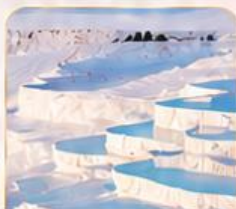
PAMUKKALE ปานุกคาล่า