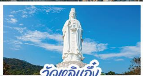
วัดเลิอัน