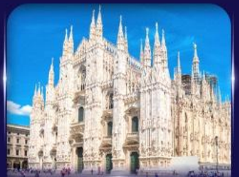
เซนต์มาร์กาเรต มิลาโน