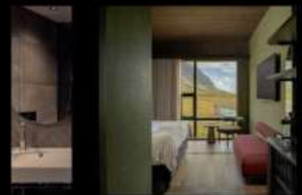
HÓTEL JÖKULSARLON - GLACIER LAGOON HOTEL