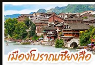
เมืองโบราณชิงสือ