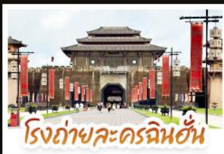
โรงถ่ายละครฉินฮั่น

ชมวิวนู๋บ้านม้งซีเจียงพันหลังคา • อุทยานเสี้ยวซิ่ง มนต์เสน่ห์จิวจิวโกวน้อย • อิสระช้อปปิ้งกับถนนคนเดิน สามตรอกสองซอย • สูดอากาศให้เต็มปอดบนยอดเขาชิงซิ่ง พร้อมชมความสวยงามของมวลดอกไม้ตามฤดูกาล