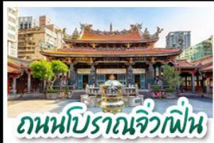
ถนนโบราณจิวเฟิ่น

ทะเลสาบสุริยันจันทรา - ล่องเรือชมวิว - จิวเฟิ่น สือเฟิ่น - TAIPEI 101 - ชีเหมินตง หนานโถว 1 คืน ไทเป 2 คืน