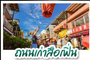
ถนนเก่าสือเฟิ่น