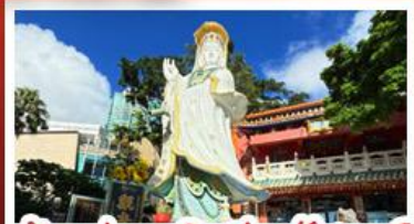
เจ้าแม่กวนอิมรัฟัสเบย์