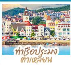
ทำเรือประมง ตาเหลียน