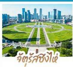
จัตุรัสซิงไผ่