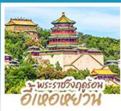
พระราชวังฤดูร้อน อี่เต๋อเฉ่ฝัวน

ทริปปเดียวเที่ยว 2 เมือง ปักกิ่ง-ต้าเหลียน • เที่ยวจีนฟีลยุโรป ณ เมืองเวนิสแห่งต้าเหลียน • สัมผัสประสบการณ์ขึ้นกำแพงเมืองจีน ด่านจวียงกวน • ช้อปปิ้ง ซิม ซิล ที่ถนนโบราณตงกวนและย่านชานหลี่กุน