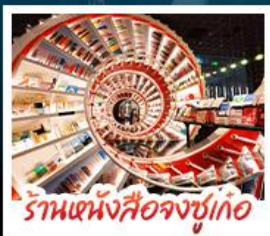
ร้านหนังสือจุงซูเกอ