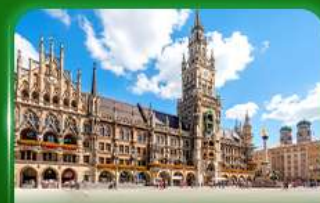
จัตุรัสมาเรียนพลัทซ์ มิวนิก