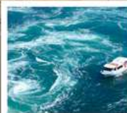
คลองเรือขมบ้านนาสุโตะ

คลองเรือขมบ้านนาสุโตะ / ซุปบึงย่านชินโซบาช / ตลาดปลาคุโรเมง / ซุปบึงย่านอุมาเดะ