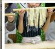
กิจกรรมทำเส้นอุด้ง