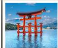
ศาลเจ้าอิตสึคุชิมะ