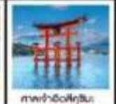
เที่ยววัดฟุกุโอกะ