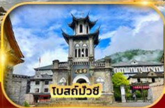
โบสถ์บัวชี่