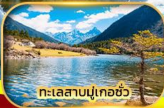
ทะเลสาบมู่เกอซัว