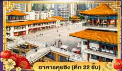
อาคารคุยฉิ่ง (ตึก 22 ชั้น)