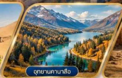
อุทยานคานาสี