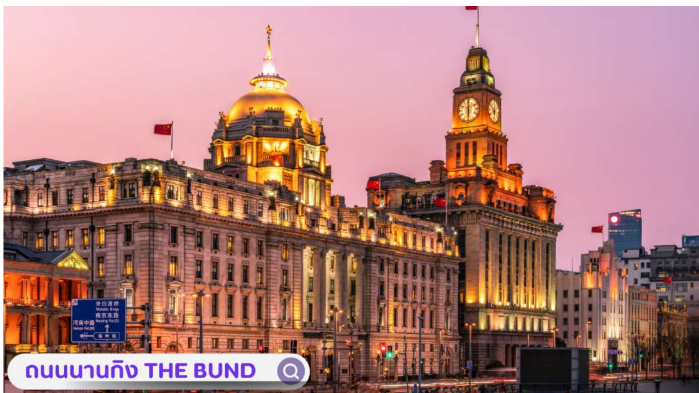
ถนนนานจิง THE BUND

ยาว 1.5 กิโลเมตร ไปตามริมแม่น้ำห้วงผู้ฝั่งตะวันตกซึ่งอยู่ในย่านเมืองเก่า หาดไ่ว่ทานยังเคยเป็นสถานที่ถ่ายทำภาพยนตร์ที่โด่งดังเรื่อง เจ้าพ่อเชียงใหม่อิสระท่านเพลิดเพลินที่ ถนนนานจิง(NANJING ROAD) เป็นย่านช้อปปิ้งเก่าแก่ที่สุดของเชียงใหม่ เป็นตลาดซื้อขายของกันคึกคักตั้งแต่ทศวรรษ 1920 ตั้งอยู่ฝั่งผู้ซีกินพื้นที่ยาวตั้งแต่ฝั่งตะวันตกของ “เดอะ บันด์” ถึง “พีเพิลส์ สแควร์” เป็นแหล่งช้อปปิ้งสินค้าแบรนด์เนมจากทั่วโลก และยังเป็นศูนย์รวมร้านค้าและร้านอาหารอีกมากมาย และพลาดไม่ได้กับนักจุ่มอาร์ททอยอย่างแบรนด์ POPMART GLOBAL FLAGSHIP STORE ร้านขายของเล่นที่เป็นที่โด่งดังในขณะนี้ไม่ว่าจะ LABUBU MOLLY SKULLPANDA และอย่างอื่นอีกมากมาย ให้ท่านได้เลือกลุ้นกันอย่างสนุกสนาน