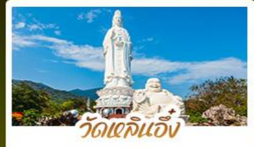
วัดเจ๊กินเจ๊ิง