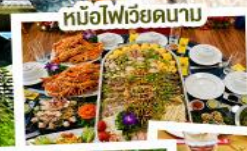
หม้อไฟเวียดนาม