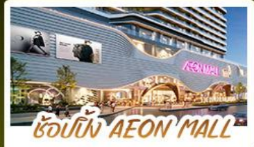
ช้อปปิ้ง AEON MALL