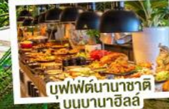
บุฟเฟ่ต์นานาชาติบนบานาฮิลล์