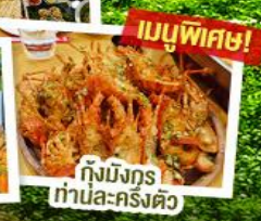
กึ่งมังกรท่านละครึ่งตัว