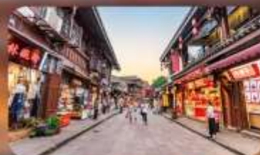
หมู่บ้านโบราณฉือซีไห่