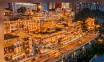
หงหย่าตั้ง