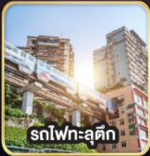
รถไฟฟ้าชุนชิ่ง