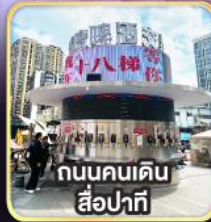
ถนนคนเดิน สี่ปาตี