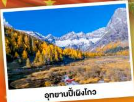
อุทยานปี้ฝิงโกว