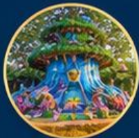
โลกแฟนตาซี Fantasy World