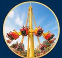
โลกการผจญภัย Adventure World