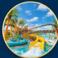
สวนน้ำไต้ฝุ่น Typhoon World