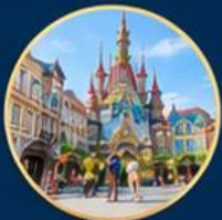
ถนนยุโรป European Streetmosphere