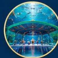
โลกใต้ท้องทะเล The Sea Shell