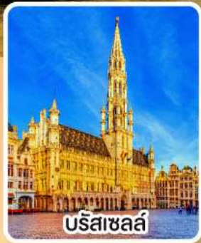
บริสเซลล์