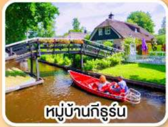
หมู่บ้านทีร์ูร์น