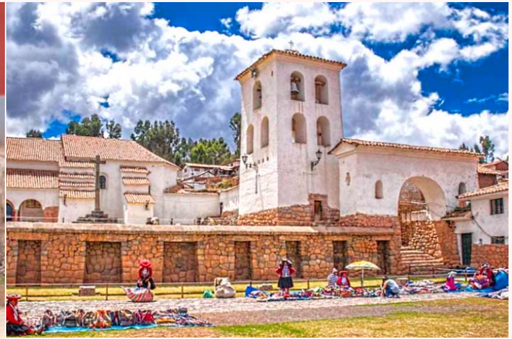
เที่ยง บริการอาหารกลางวัน ณ ภัตตาคาร Hanka Restaurant