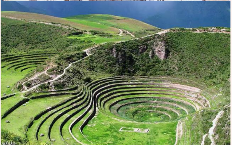
บ่าย นำท่านเดินทางสู่ มาราซ (Maras) แหล่งผลิตเกลือที่คุณภาพดีที่สุดในโลก ที่มีมาตั้งแต่สมัยอินคา แวนาชันบันไดที่เรียงอยู่ตามลำดับความสูงของภูเขา จากนั้นเดินทางสู่ โมเรย์ (Moray) นาขั้นบันไดวงกลมขนาดใหญ่หลายๆรูปร่างแปลกตาที่ชาวอินคาทำไว้เพื่อทดลองปลูกพืชพันธุ์ต่างๆ จากจุดนี้สามารถมองเห็น หมู่บ้านอูรัมบัмба (Urubamba) ได้อีกด้วย ได้เวลาเดินทางกลับสู่เมือง เมืองคัสโก (Cusco) เมืองหลวงของอาณาจักรอินคา ที่แพร่ขยายอำนาจจนกินพื้นที่ 1 ใน 3 ของอเมริกาใต้ ตั้งอยู่เหนือระดับน้ำทะเลถึง 3,400 เมตร และเป็นแหล่งอารยธรรมยุคก่อนประวัติศาสตร์ที่ลึกลับน่าทึ่ง เป็นชุมชนเก่าแก่ของจักรวรรดิอินคาอันรุ่งเรือง ซึ่งยังคงทิ้งร่องรอยความเจริญไว้ให้เห็นเป็นซากปรักหักพังโบราณและโบราณวัตถุต่างๆ