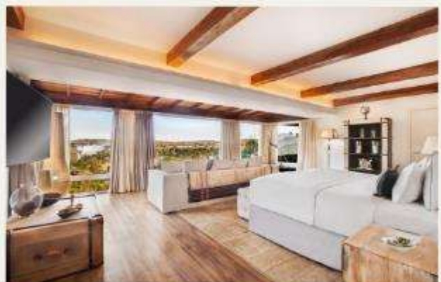
Hotel das Cataratas, A Belmond Hotel